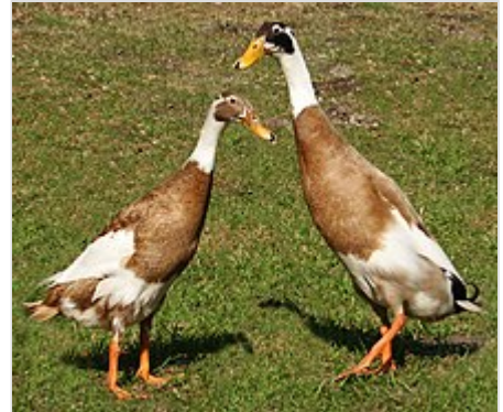
Zwei Laufenten, rehbraun-weiß-gescheckt

Laufenten werden in Deutschland in folgenden zehn Farbschlägen gezüchtet: wildfarbig (vergleichbar der Stockente ), forellensfarbig, silberwildfarbig, rehfarbig-weißgescheckt, erbsgelb, blaugelb, weiß, schwarz, braun und blau. Die in Deutschland anerkannten Farbschläge müssen durchgezüchtet sein und dürfen nach der Verpaarung nicht in andere Farben aufspalten.