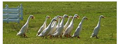
Eine Gruppe weißer Laufenten