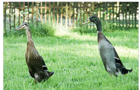
Zwei Laufenten, wildfarbig