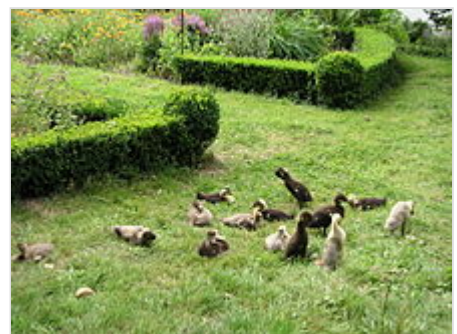
Zwei Wochen alte Laufenten ( Küken ) in einem Garten